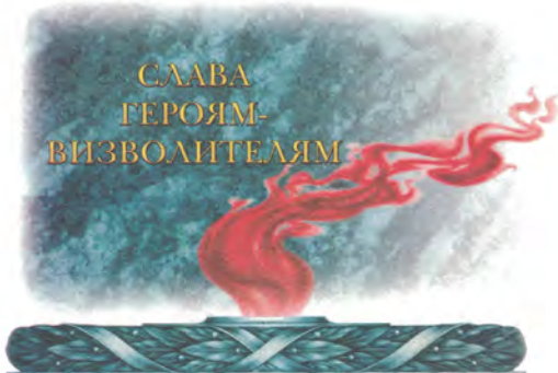
60 - річчя ВИЗВОЛЕННЯ УКРАЇНИ ВІД НІМЕЦЬКО - ФАШИСТСЬКИХ ЗАГАРБНИКІВ